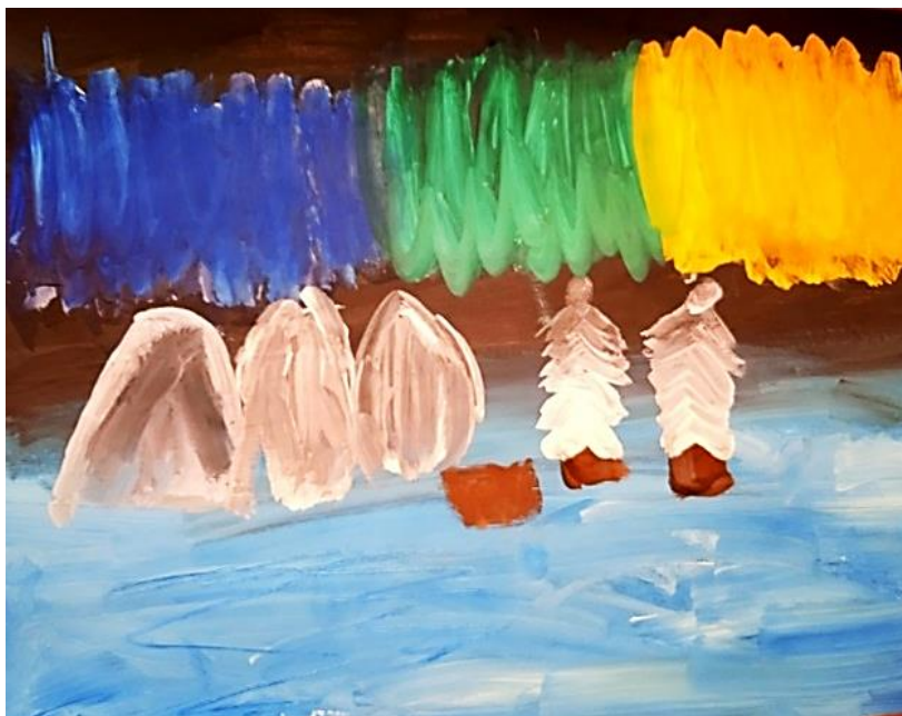
Рисунок Бедокуровой Анастасии

Это было в январе Я каталась с горки На ледянке далеко Вылетала громко Вот такие выходные Проводила в парке.