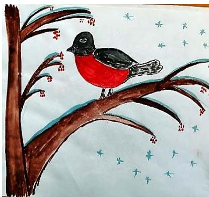
Рисунок Замановой Гульнары, группа «Акбузат»

Ой какие снегири Посмотри на снегирей Цвета утренней зори На снегу сидят красавицы