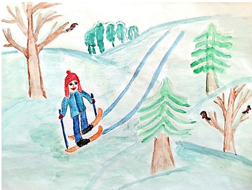
Рисунок Муллагалеева Роберта, группа «Акбузат»

А вокруг сугробы только Детвора в снежки играет Собрались мы все у елки Дед Мороз подарки дарит