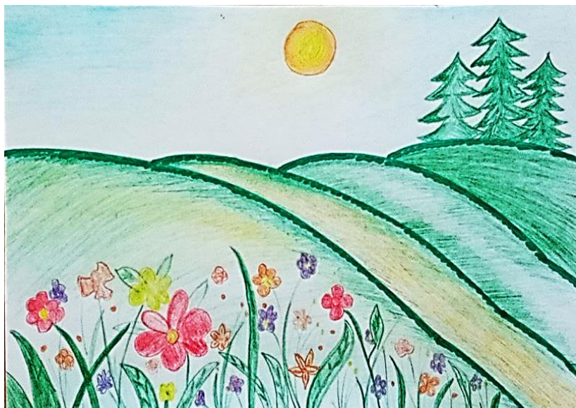
Рисунок Трошина Семёна

Башкортостан- мой край родной Люблю твои леса и реки, Озера с чистою водой С тобой, душою я навеки.