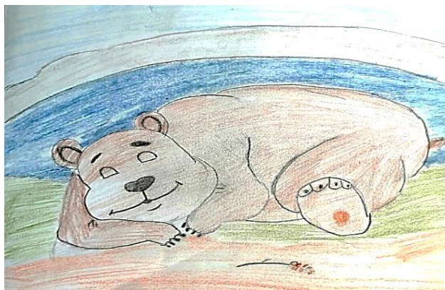
Рисунок Симонова Максима

Медвежонок косолапый Спит своей берлоге Зимой привык он спать Летом любит он кушать Сладкий и душистый мёд