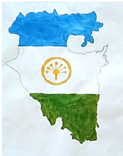
Рисунок Волошиной Елизаветы

Башкортостан — мой край родной Горжусь и радуюсь тобой Твои долины и поля Все это ты, любимая земля