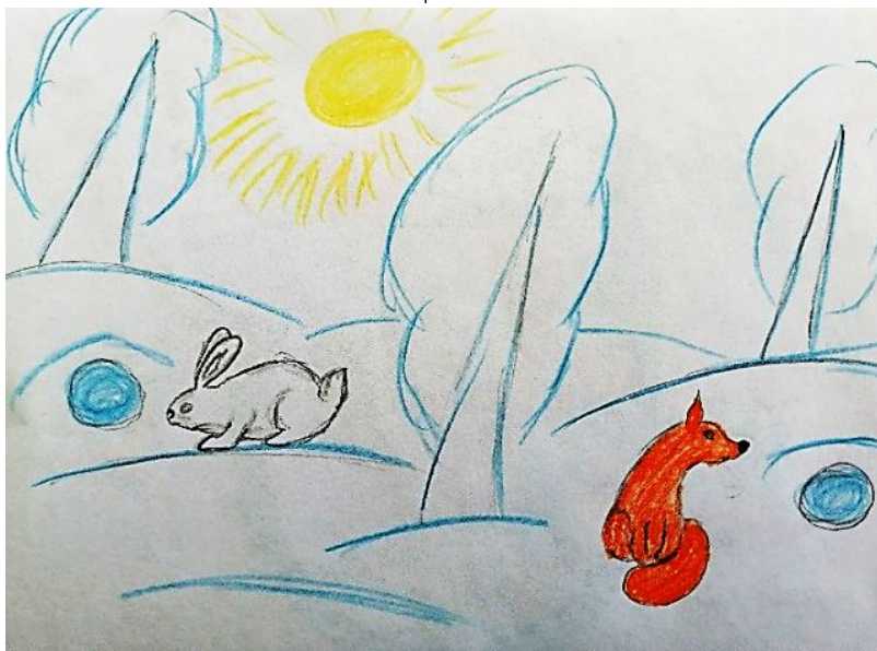
Рисунок Комаровой Анны

До марта скованы пруды, В сугробы закутаны сады. Ветер крыльями стучит, Весна ещё к нам не спешит.