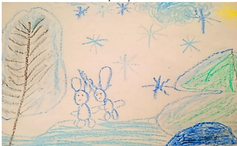
Рисунок Янбаева Ильдара

Зимушка-зима придёт Вьюга песни запоет И пойдут зверята спать А весной проснутся опять.