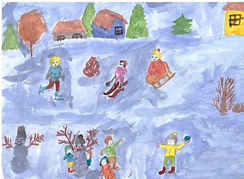
Рисунок Булатовой Виктории, группа «Звездочки»