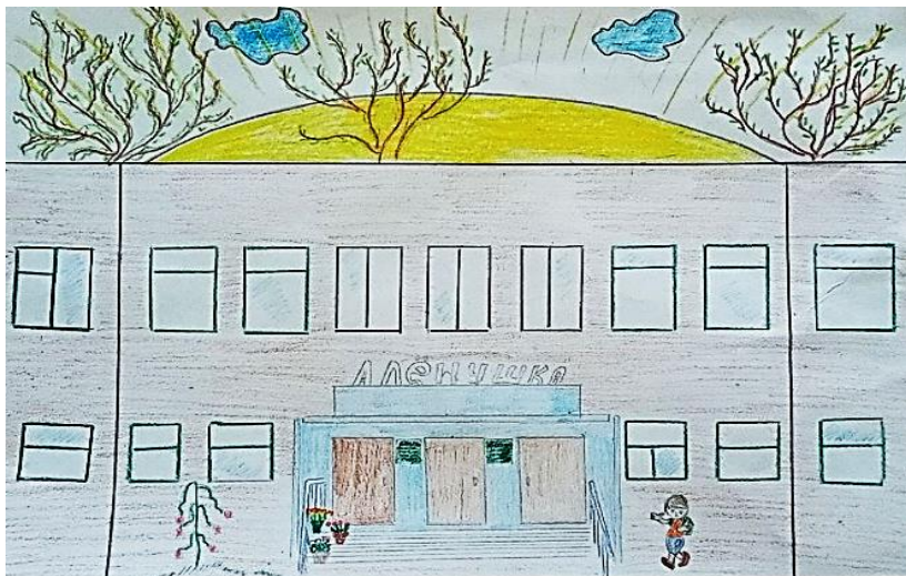
Рисунок Комарова Александра

Красивый и гордый наш Южный Урал И есть тут красивый наш город Сибай И тут я родился, и тут я расту, И в садик «Аленушка» тут я хожу Красивый и гордый наш Южный Урал Тебя я люблю, родней нет тебя!