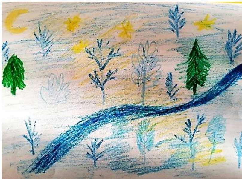
Рисунок Алексеевой Фаины

Как хорошо в лесу зимой! И снег искрится под луной Звезда на небе так сияет Мне путь, дорогу освещает.