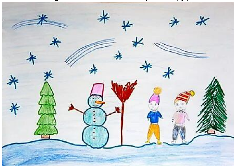
Рисунок Дубова Матвея

Мороз - добряк спешит во все селенья! Ах, этот зимний блеск! Не передать! Трещат полы от бурного веселья! В кругу друзей так здорово гулять! Едва ли кто-то мог бы здесь скучать! И я, Матвей, любви желаю, счастья! Душевных, верных, искренних друзей!