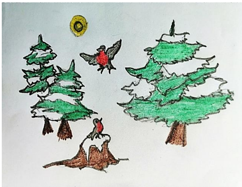
Рисунок Юлдашкильдиной Миланы

Падает, падает белый снежок В воздухе тихо кружится. Как хорошо, что зима на дворе, Всюду довольные лица. Птицы и звери, деревья, кусты Тоже зиме очень рады! Снятся им сладкие зимние сны, Под снежным большим одеялом.