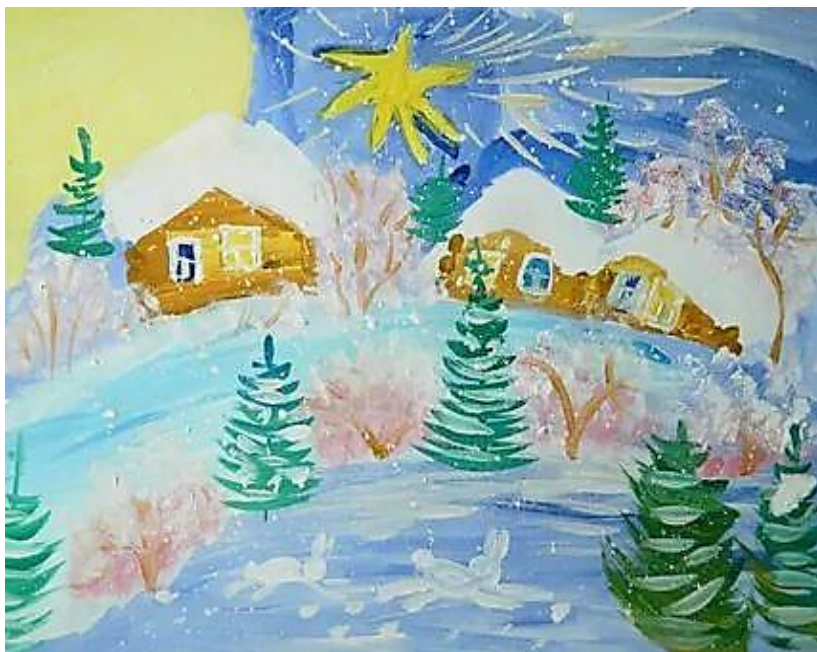
Рисунок Каримовой Виктории

Наступила белая зима. Превратив все в ледяную сказку. Укрыты пеленой леса, поля, А реки как стеклянную надели маску. Природа спит, окутанная тишиной. Все стало белым и холодным царством. Красивая зима любима мной, Она таинственна, но так прекрасна!