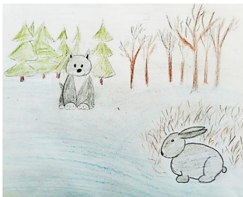
Рисунок Нелюбиной Софии

Беленький зайчишка Спрятался в кустах Потому- что рядом Ходит серый волк