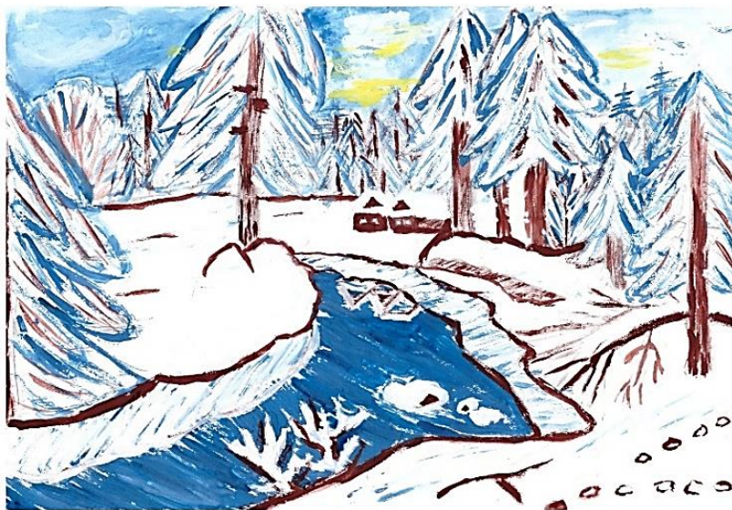
Рисунок Никитина Михаила, группа «Звездочки»

Зима пришла! Снежок кружится. Во дворе на горке детвора веселится! Ох, как на улице крепчает мороз! Без варежек щиплет руки и нос. Иней укрыл деревья своим одеялом. Так, что всем тепло, тепло стало!!!