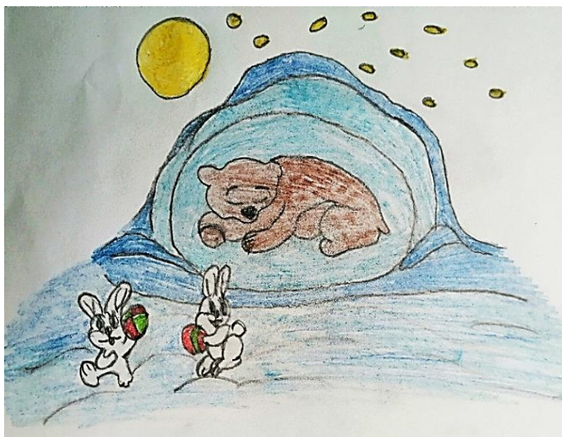
Рисунок Трофимова Никиты

Спит в берлоге бурый мишка С ним играть пришли зайчишки. Тише зайцы, не шумите. Мишку Тишку не будите. Ведь спросони злобный он! Вход зайчишкам запрещен!