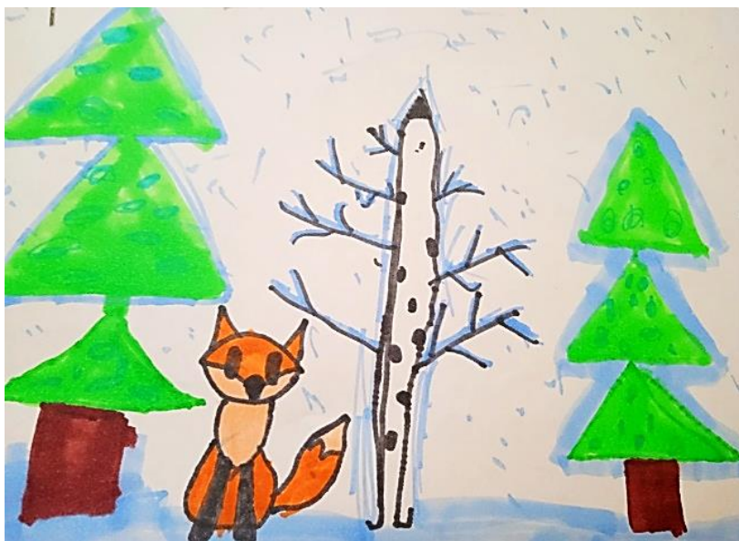
Рисунок Шевкунова Артема

Гуляли на празднике В зимнем лесу Шишки сосен собирали. Там мы встретили лису И её нарисовали.