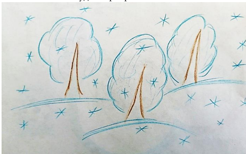
Рисунок Мансурова Платона

Наконец пришла зима Под моим окном. Белым снегом сад покрыло Будто серебром.