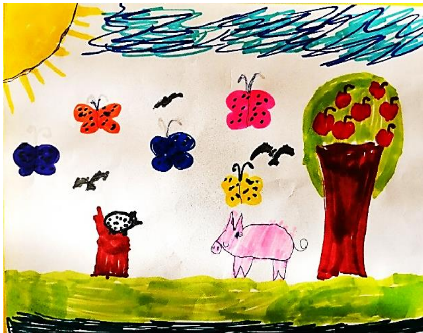
Рисунок Котовой Александры