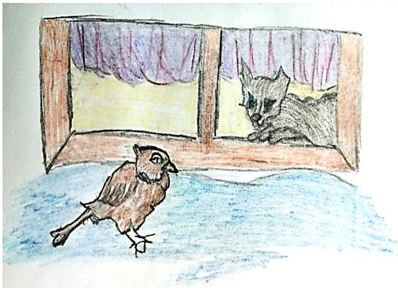
Рисунок Барышева Артема

Воробей влетел в окошко. Убегал от злой он кошки. «Брысь! — сказал я этой кошке! — Ты иди своей дорожкой!»