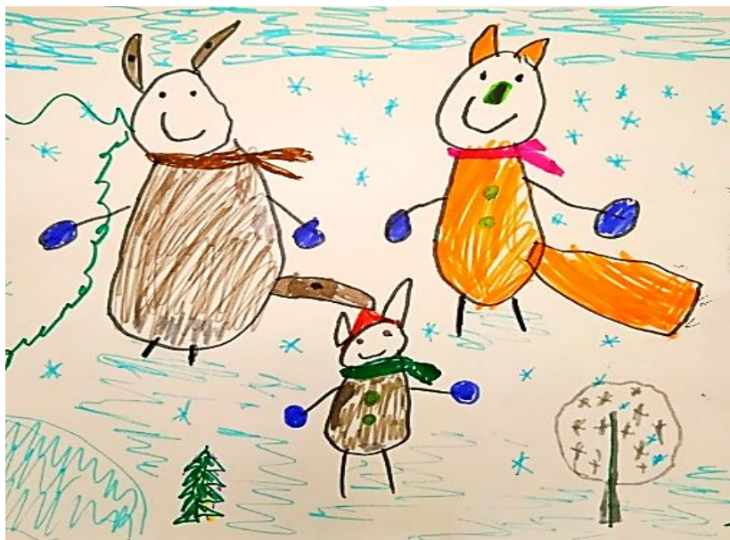
Рисунок Тангатаровой Элины

На лесной опушке Собрались зверюшки Поиграть в снежки решили Зимним солнечным деньком И лисёнок, и зайчонок, И волчонок вон бежит. Медвежонка с ними нет, Где же он? В берлоге спит!