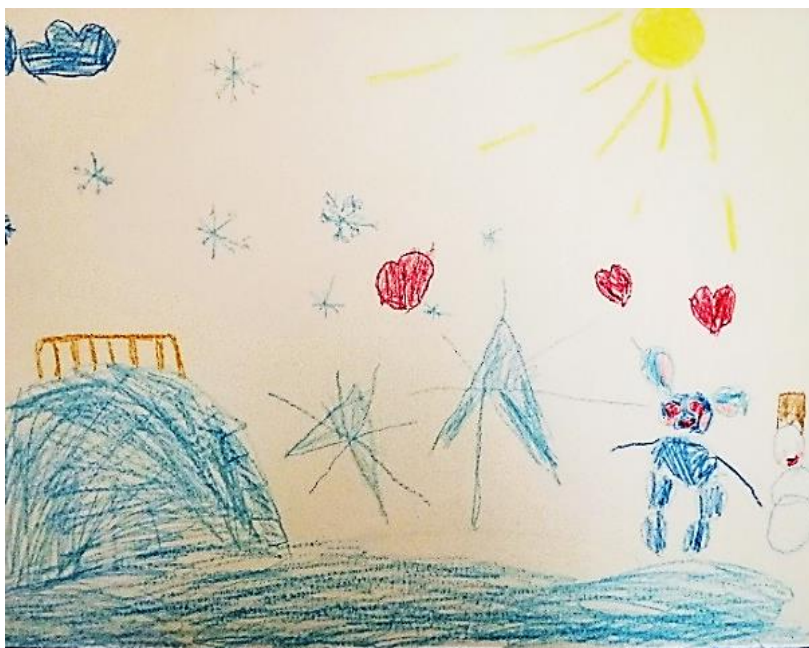
Рисунок Кокотюхи Вероники

Зима, зимушка, зима Снегом всё укутала Горки ледяные, окна расписные Эй, держись чудной народ, К нам грядёт Новый год!