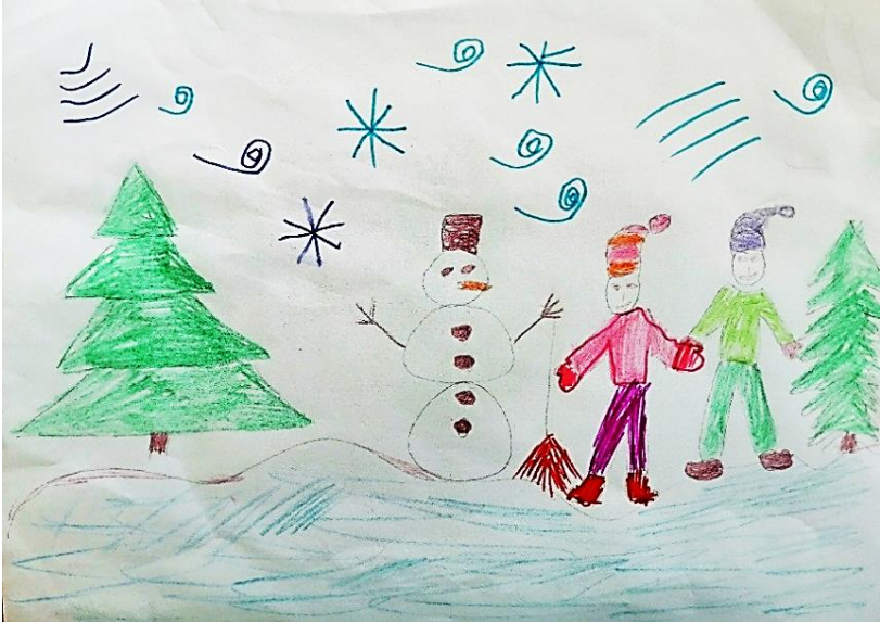
Рисунок Гареевой Лейлы