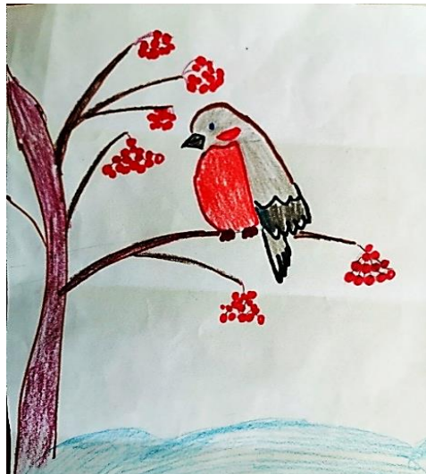
Рисунок Муталлапова Богдана

Прилетел снегирь и на рябину сёл. Очень он весёлую песенку запел! А как песню спел, ягодку он съел, Помахал крылом и тихо улетел!